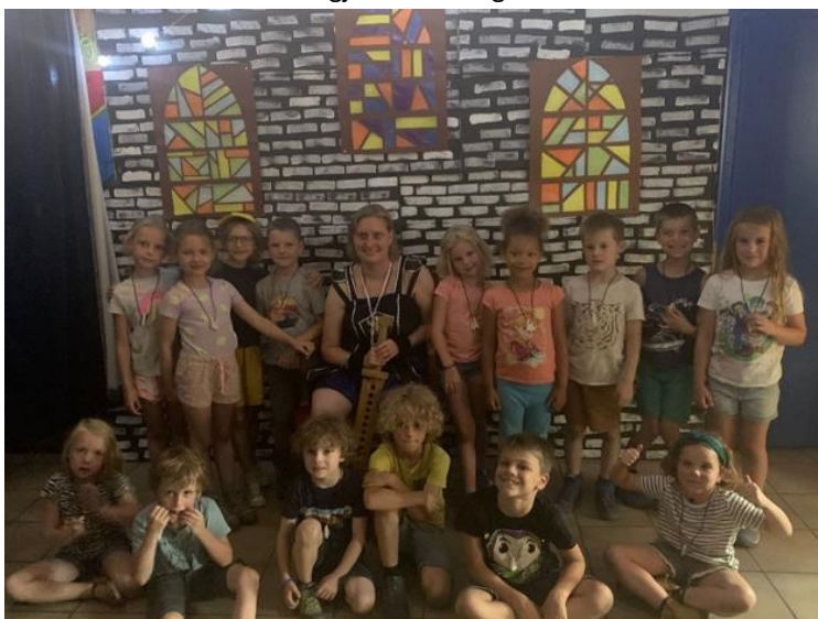
Groepsfoto zomerkamp 2022

Deze zomer hebben wij een fantastisch zomerkamp gehad. Jullie hebben allemaal spelletjes gespeeld en zijn zo toegetreden tot de Geheime Drakenorde. Nu blijft het natuurlijk aan jullie om de draken te beschermen. Weten jullie ook nog het laatste zomerkamp programma? Wij absoluut wel, want jullie waren ontzettend lief in de speeltuin Fort Willem. Na een lange zomervakantie is het nieuwe scoutingjaar weer begonnen.